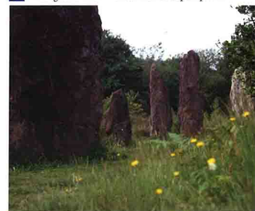
Alignement des Pierres Droites

D1 Parking du site des Pierres Droites (départ possible).